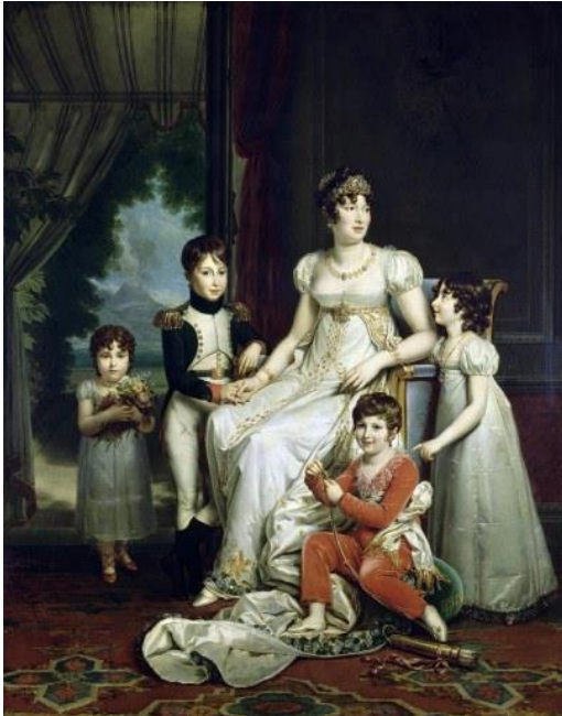
Caroline et ses enfants par le peintre Gérard

Sans nouvelles de Caroline, Murat ne cesse de s'inquiéter. Le 14.06.1815 , il apprend par un réfugié de son ancienne cour, qu'un armistice a été signé à Naples avec les Autrichiens et que toutes les places fortes, citadelles, magasins, dépôts d'artillerie, ports et arsenaux militaires du Royaume de Naples ont été remis sans condition le 23.05.1815 .