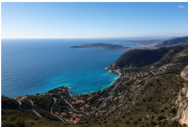
Vue de la Grande Corniche

Dubouchage est également un préfet visionnaire : il voulait faire percer le tunnel de Tende (fin des travaux en 1882) ou créer des routes carrossables jusque dans l'arrière-pays pour l'acheminement des troupes mais aussi pour désenclaver des communes complètement inaccessibles l'hiver. Mais, faute de temps, la concrétisation de ses projets ne sera effective que beaucoup plus tard.