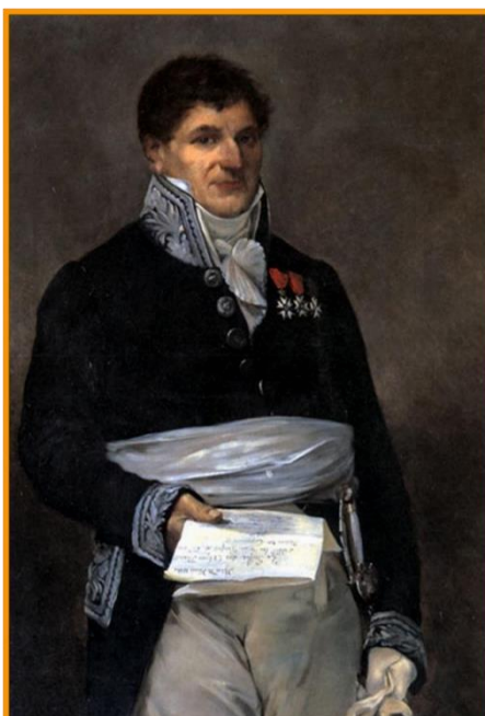
Marc-Joseph Gratet, Comte Dubouchage

En 1789, il est un homme fort dans l'armée royale, mais un événement va bouleverser sa vie : la Révolution française. Le 14 juillet 1789, la Bastille est prise, l'intendant de Paris est massacré ; les événements s'enchaînent ensuite : le roi est humilié, le trône est renversé, la terreur s'abat sur le pays, en particulier sur les prêtres et les nobles. Il est contraint, comme beaucoup d'aristocrates, à l'exil en 1792. Il y restera jusqu'en 1795, date à laquelle il intègre les assemblées provinciales du Dauphiné, sa région d'origine. Après le Coup d'État de Bonaparte les 18-19 Brumaire An VIII (9-10 novembre 1799), Dubouchage est réintégré dans l'administration, bien qu'ayant des tendances royalistes. C'est à partir de 1800 qu'il va se révéler au grand jour : le Premier Consul le nomme le 17 mars 1803 préfet des Alpes-Maritimes.