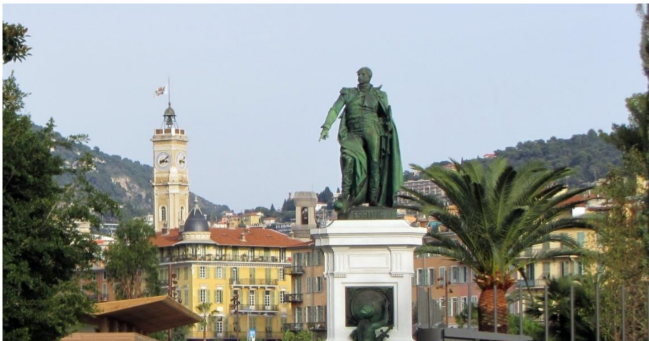
Statue d'André Masséna, maréchal d'Empire, Prince d'Essling, sur la Promenade du Paillon à Nice