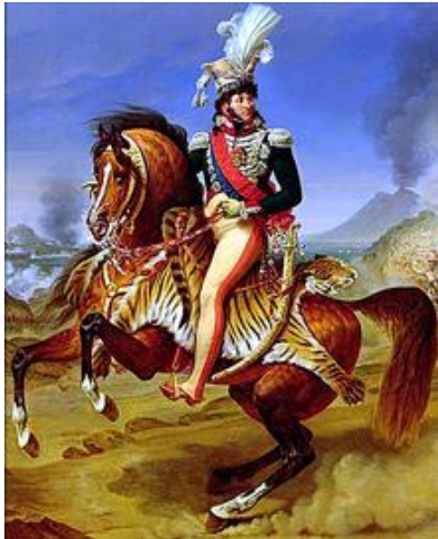
Antoine Gros. Joachim Murat