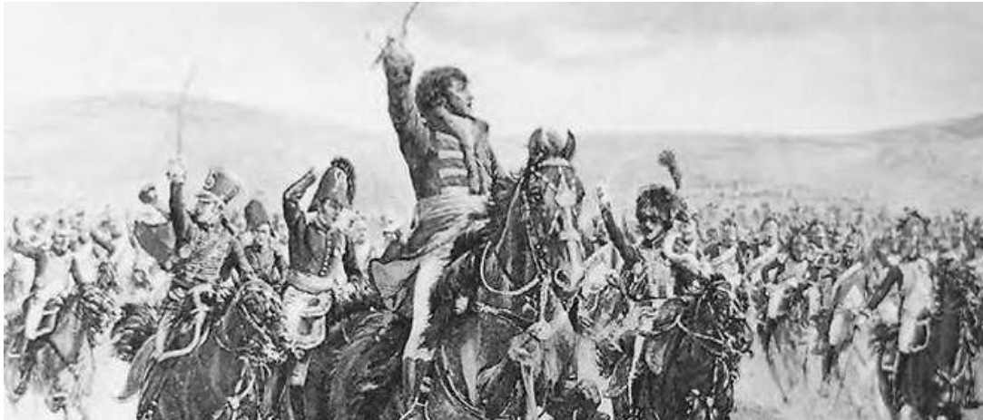
Murat chargeant à léna

Murat arrive à Naples le 06.09.1808 et reçoit un accueil triomphal qui nourrit sa passion des honneurs et du pouvoir. Mais la question demeure quant à sa capacité d'assumer sa charge. Talleyrand dont on ne peut douter de la lucidité politique posera crûment la question à Caroline aux Tuileries en février 1809 : « Votre époux est le plus merveilleux sabreur qui soit mais ce ne sont pas les qualités suffisantes pour bien diriger un Etat... » (4).