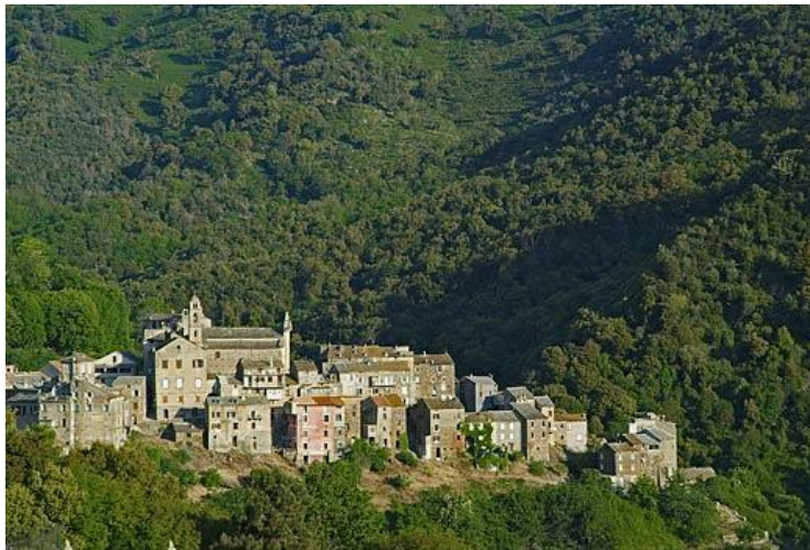
Village de Vescovato

Le 22.08.1815 , vers 11 heures du soir , habillé en paysan, Murat s'embarque avec trois acolytes dans la baie de Toulon à hauteur de la plage de Castigneau, sur une barque non pontée, dans des conditions climatiques défavorables sous un vent violent. Plusieurs fois la barque risque de chavirer ; il faut écopier avec les chapeaux. Le 23.08.1815 l'embarcation en perdition réussit à joindre dans l'après-midi, au large d'Hyères, le bateau-poste reliant Toulon à la Corse, commandé par un certain Michel Bonnelli. Murat est méconnaissable, il porte une barbe de plusieurs jours, ses vêtements sont dans un état douteux, il n'a plus de chapeau mais un bonnet de soie noire et porte des gros souliers. Il se fait appeler « Campomelle » mais finit par se faire connaître car il rencontre à bord de nombreux corses qui fuient Marseille et qui le traitent en roi et l'ancien commissaire de guerre Galvani. A l'aube du 25.08.1815 , après une navigation sans aléas, il débarque à Bastia. On lui conseille de ne pas s'attarder dans la ville et de chercher refuge à Vescovato à trois lieues au sud de Bastia, où il retrouve son aide de camp, le général Franceschetti qui l'accueille avec émotion.