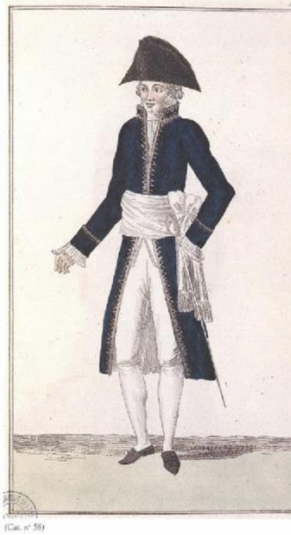
Un préfet lors de la création du corps, en 1800