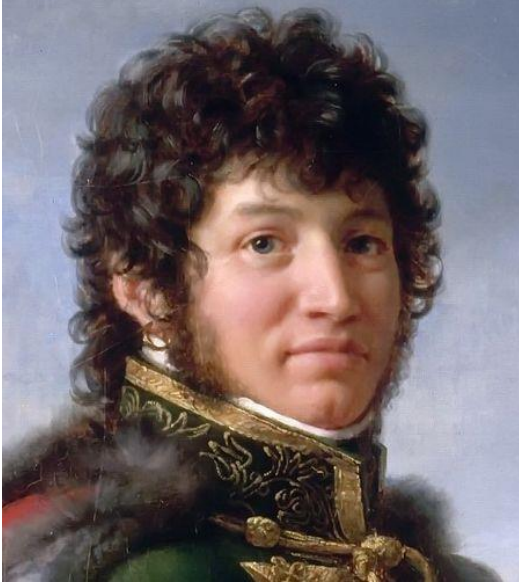
Joachim Murat par F. Gérard

Lui le fils d'un petit aubergiste du Lot, ancien séminariste devenu flamboyant cavalier, sabreur, téméraire meneur d'hommes alliant l'audace à une élégance étincelante ; lui qui a joué un rôle déterminant le 13 vendémiaire, qui a été nommé Général de division sur le champ de bataille d'Aboukir le 25.07.1799, lui qui a pris une part essentielle lors du coup d'état du 18 Brumaire, devenu beau-frère de Napoléon en épousant Caroline le 20.01.1800, puis Maréchal d'Empire, Prince Impérial, Grand Amiral de France, Altesse Royale, Grand-Duc de Clèves et de Berg en mars 1806, Lieutenant général de Napoléon 1er en Espagne en février 1808, et enfin Roi de Naples et de Sicile depuis le 15.07.1808. Pour bien comprendre, il nous faut revenir quelques années en arrière.