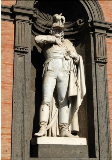
Statue du Roi Joachim Murat. Palais royal de Naples

Effectivement l'Italie finira par rendre, au fil des années, un hommage unanime à la mémoire du Roi de Naples ; les Napolitains lui élèveront une statue sur la façade du Palais Royal. Garibaldi l'appellera : « Le valeureux vainqueur de la Moskowa » et « Le Brave des braves ».