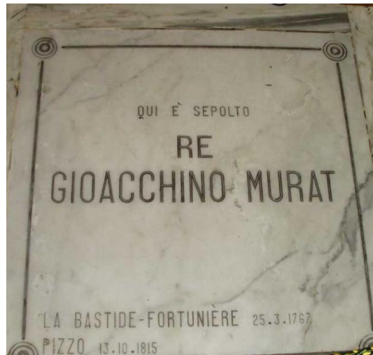
Plaque dans l'église du Pizzo