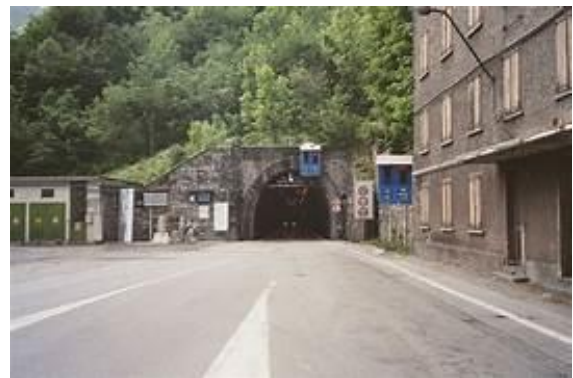
Tunnel de Tende