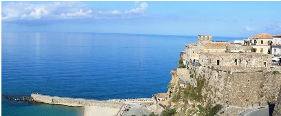
Fort de Pizzo de Calabre

Au sommet, un petit château construit autrefois par les Espagnols. Conscient du péril qu'il encourt, vers 9h30 du matin, Murat débarque avec sa trentaine d'hommes, officiers, soldats et domestiques. Il est en tenue de militaire. Il porte un frac bleu foncé aux épaulettes en or, une ceinture écharpe dans laquelle il a placé deux pistolets et un sabre, des pantalons de nankin blancs sur des bottes. Pas de décoration, juste une cocarde de 22 diamants à son bicorne (5). Ils progressent vers la place où se trouvent de nombreux habitants car c'est jour de marché. Peu d'enthousiasme ; quelques « Vive Joachim ». Les Calabrais se souviennent de la répression sanglante initiée par son bras-droit, Manhès.