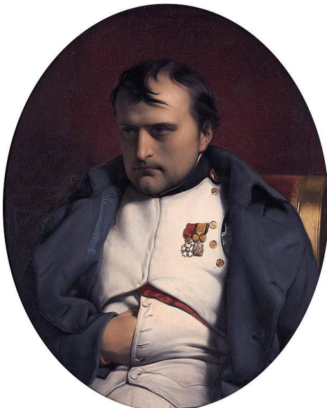
Napoléon à Fontainebleau. 01.03.1814. Par Paul Hippolyte Delaroche. (1797-1856)

Mais cette alliance est contestée par les alliés. De leur côté, les Anglais ont refusé de signer un armistice avec Murat. La menace anglaise sera toujours présente. Pour Louis XVIII et pour Talleyrand qui négocie au Congrès de Vienne, Murat est « illégitime » ; il faut le détrôner pour effacer cette trace de la Révolution. Le royaliste Pozzo di Borgo résumera la situation en affirmant : « Tous les faquins créés par Bonaparte doivent cesser d'exister... ». Murat est torturé par les remords. Il écrit à l'Empereur le 15.01.1814 pour lui annoncer le Traité conclu avec l'Autriche et finit la lettre par : « J'ai besoin d'apprendre que vous m'aimez encore, parce que je vous aimerai toujours. » (4). A Madame Récamier de passage à Naples, qui lui reproche de ne pas avoir pris le parti de la France, il déclare soudainement : « Je suis donc un traître ? Qu'y faire ? Il est trop tard... » (4).