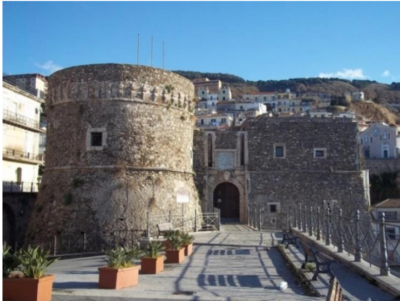
Le Fort de Pizzo de Calabre