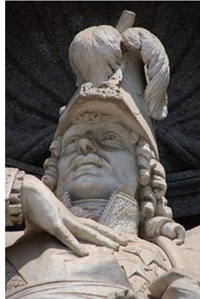
Statue du Roi Joachim Murat à Naples

A Pizzo on placera en 1900, au-dessus de l'entrée du vieux château, une plaque rappelant la « mémoire bénie du roi Joachim Murat, Prince glorieux dans la vie, intrépide devant la mort. »