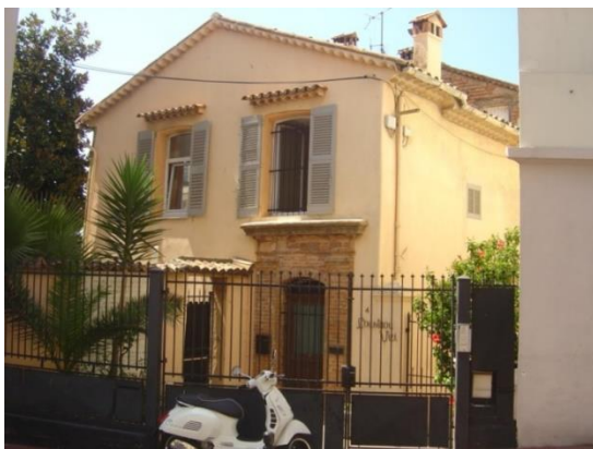
L'Oustaou Viei. Cannes.

Le Maréchal Brune qui s'est vu confier par l'Empereur l'armée d'observation du Var et la gouvernance de la 8ème division militaire se rend d'abord à Marseille en pleine effervescence, puis à Toulon. Alors qu'il va prendre le commandement de ses troupes à Antibes, il s'arrête à Cannes dans la matinée du 08.06.1815 . Il a un entretien d'une heure avec Murat à la batterie Saint-Pierre située à droite de l'auberge de la poste. La fin de l'entretien a lieu en présence du général Merle. Après le déjeuner, le Maréchal Brune poursuit sa route vers Antibes. Brune déclare qu'il fera tout ce qui est en son pouvoir pour aider Murat à rejoindre l'Empereur.