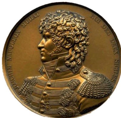
Médaille Murat Roi de Naples

Le 30.03.1815 , Murat lance une proclamation exaltée à Rimini appelant les Italiens à l'insurrection. Les scènes de joie de l'année précédente se répètent dans toute la péninsule et Joachim fait une entrée triomphale dans Bologne. Mais son armée est médiocre et composée d'à peine 40.000 hommes sans cohésion, face à 150.000 Autrichiens commandés par Neipperg et Bianchi. Mis en échec à Occhiobello par les Autrichiens retranchés derrière le Pô, Murat bat en retraite sur Ancône. Il est sévèrement battu à Tolentino le 02.05.1815 ; malgré ses prouesses sur le terrain, ses charges successives, son courage, il constate la dissolution de ses troupes soumises à des désertions en masse. Il se résigne à reculer et vit une indescriptible déroute.