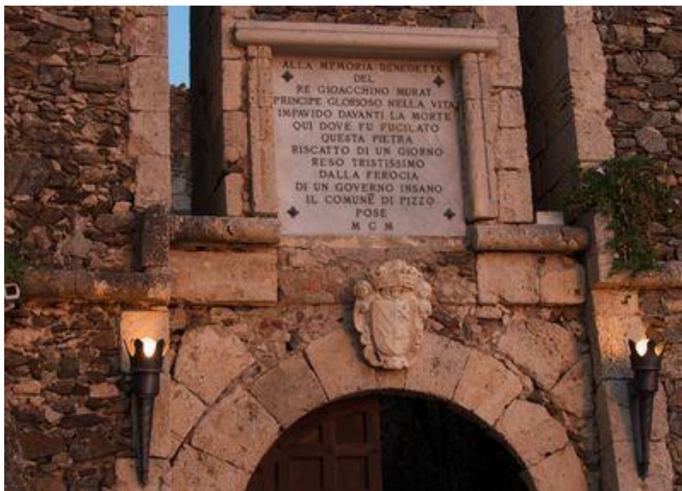
Plaque commémorative au-dessus du porche du fort du Pizzo

A Pizzo on placera en 1900, au-dessus de l'entrée du vieux château, une plaque rappelant la « mémoire bénie du roi Joachim Murat, Prince glorieux dans la vie, intrépide devant la mort. »