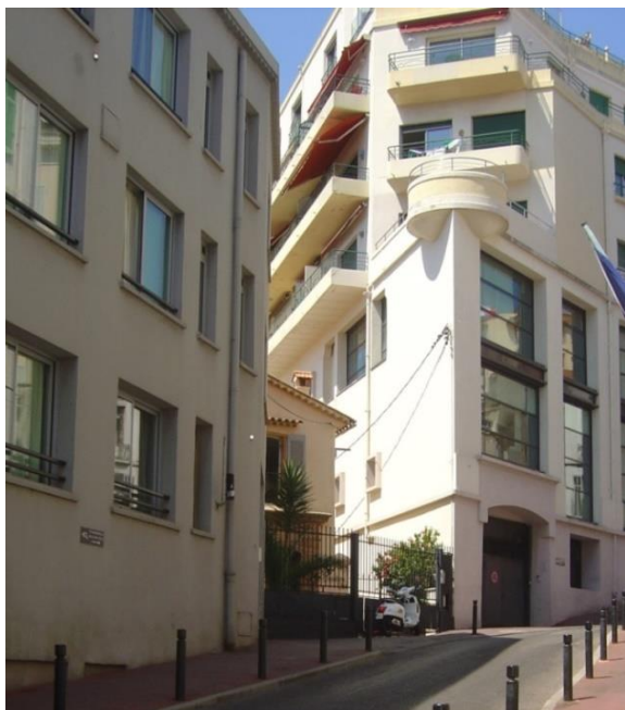
Hôtel du Relais de la Poste entre deux immeubles. Cannes.

A Cannes, au pied de la tour de la vieille ville du Suquet, en face du square Joseph Hibert, la petite rue du Port relie le Quai Saint-Pierre au boulevard Clemenceau. Au numéro 4, en retrait dans le virage de cette rue en forte pente, une habitation à un étage abritait autrefois l'Hôtel du Relais de la Poste.