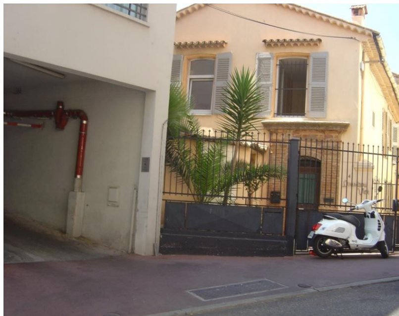
L'Oustaou Viei ou Hôtel Pinchinat. Cannes.

Ce relais très fréquenté a été tenu par les Maîtres postiers de la famille Pinchinat pendant les XVIIIème et XIXème siècles. Ses chambres offraient alors un magnifique panorama sur la mer et sur la rade de Cannes. A présent les immeubles l'étouffent complètement. Les quelques locaux qui subsistent sont cernés par une sordide entrée de garage à gauche et par un immeuble très haut à droite. La vue est totalement obstruée.