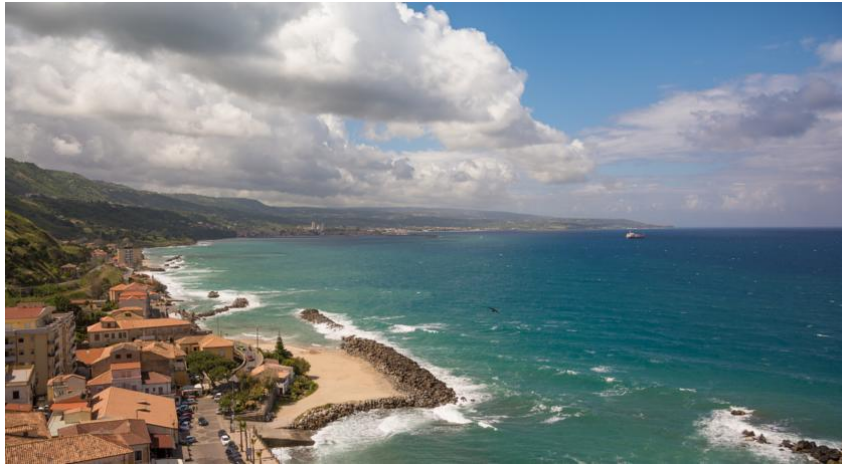
Vue depuis le fort de Pizzo de Calabre

Au sommet, un petit château construit autrefois par les Espagnols. Conscient du péril qu'il encourt, vers 9h30 du matin, Murat débarque avec sa trentaine d'hommes, officiers, soldats et domestiques. Il est en tenue de militaire. Il porte un frac bleu foncé aux épaulettes en or, une ceinture écharpe dans laquelle il a placé deux pistolets et un sabre, des pantalons de nankin blancs sur des bottes. Pas de décoration, juste une cocarde de 22 diamants à son bicorne (5). Ils progressent vers la place où se trouvent de nombreux habitants car c'est jour de marché. Peu d'enthousiasme ; quelques « Vive Joachim ». Les Calabrais se souviennent de la répression sanglante initiée par son bras-droit, Manhès.